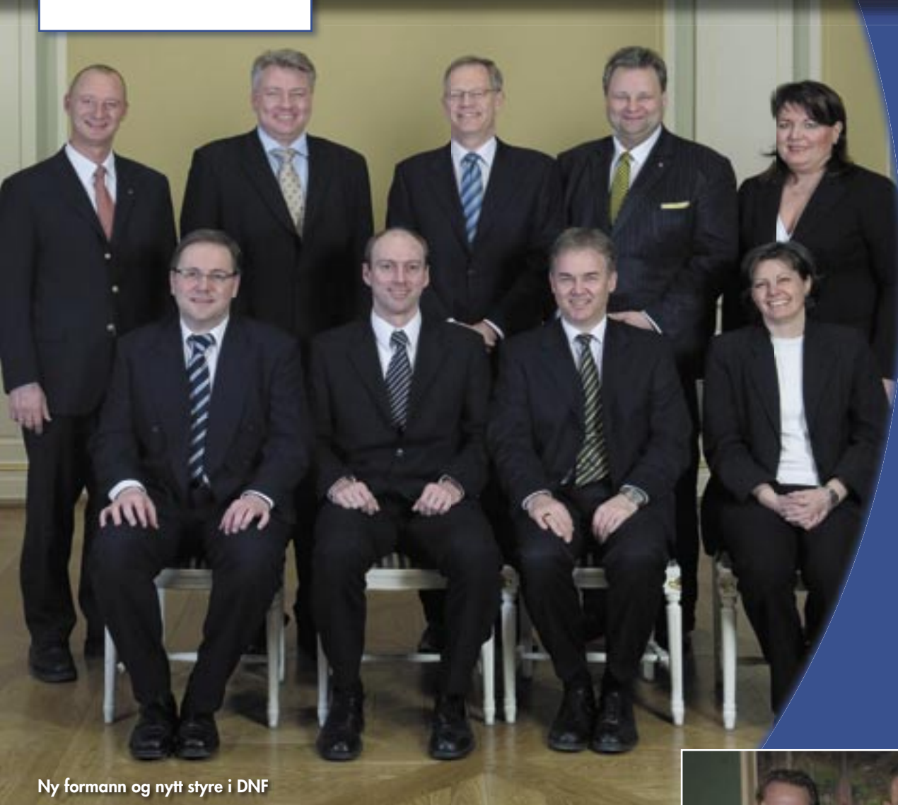
Ny formann og nytt styre i DNF

DNFs medlemsblad nr. 2 - Mars/april 2007 - 56. årgang