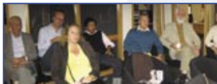
Deltagere på samlingen hos Catapult Film.