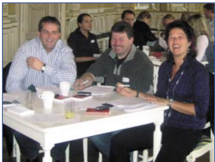
Blide deltagere på det populære kurset: HMS for ledere.

Siste dato for kurs vil være 5. desember.