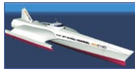
Den planlagte hurtigfergen mellom Drammen og kontinentet.

Dørene åpner kl. 09.00, og vi holder det gående frem til kl. 16.00 med foredrag, åpent standområde, lunsj og spennende kollegaer fra næringslivet i Drammensregionen. Gratis adgang. Invitasjon kommer.