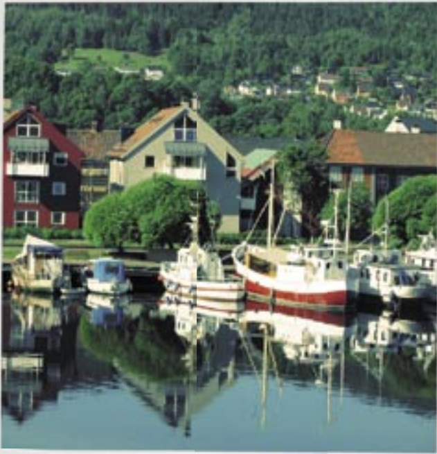
Norges største veikryss

DNFs medlemsblad nr. 4 - Aug./Sept. 2006 - 55. årgang