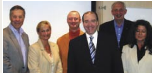
Næringsforum Oslofjord Vest i Amsterdam

Finn ut mer om hvorfor Drammen er bedre enn sitt rykte på www.elvebyen.no