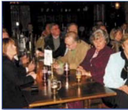
Fra bystyrets samling i Gildehallen høsten 2005.

Før forrige kommunevalg i Drammen spilte DNF inn viktige næringspolitiske saker til alle de politiske partiene. Partiene var gjennomgående svært positive til våre innspill og flere bad om utdypende møter før utarbeidelsen av sine partiprogrammer. Resultat: Alle de politiske partiene implementerte mange, noen alle, DNFs innspill i sine partiprogrammer.