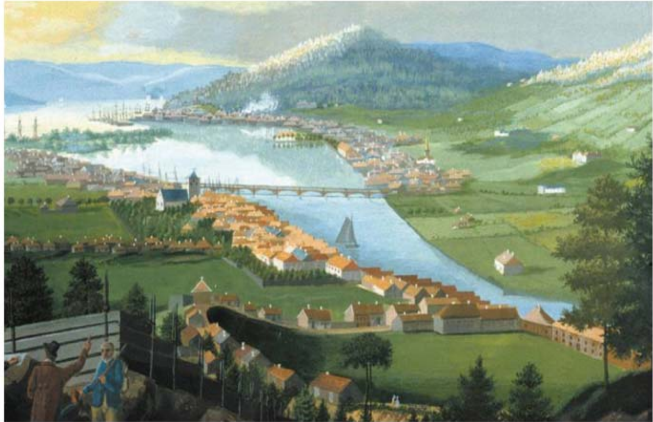
Gouache: Hans P. Dahm/Drammens Museum.